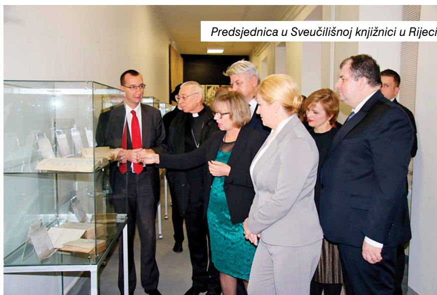
Predsjednica u Sveučilišnoj knjižnici u Rijeci

Visoka obljetnica seže duboko u povijest kada je prije 390 godina u Rijeci osnovan isusovački kolegij. Slijednice te prve riječke ustanove za obrazovanje danas su Prva riječka hrvatska gimnazija, Prva sušačka hrvatska gimnazija i Sveučilišna knjižnica.