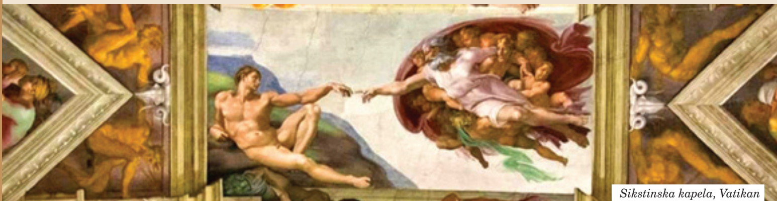
Sikstinska kapela, Vatikan

U župama grada Rijeke tražit će se prikladni pastoralni načini za uklapanje nekih vidova pastoralnog djelovanja u programe obilježavanja 'Rijeke kao europske prijestolnice kulture 2020.'. Bit će organizirani susreti i tribine na različitim crkvenim razinama u svezi teme pastoralne kulture i inkulturacije vjere. Poseban poziv upućen je svim vjernicima na uključivanje u društveno-kulturna i pastoralna događanja koje organiziraju središnje crkvene ustanove, a posebno ona koje organiziraju nadbiskupski ordinarijat, katedrala sv. Vida i Teologija u Rijeci.