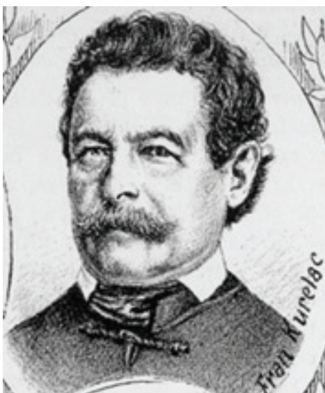
Bogoslav Šulek – jezikoslovac, leksikograf i prirodoslovac, svojim je leksikografskim radom dao važan doprinos polifunktionalnosti hrvatskoga jezika u drugoj polovici 19. st.