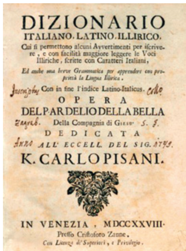
Naslovnica rječnika Ardelija Della Belle Dizionario italiano, latino, illyrico (Mletci, 1728.)

Primjetno je da se u ovom razdoblju piše, tiska i čita daleko više nego ranije.