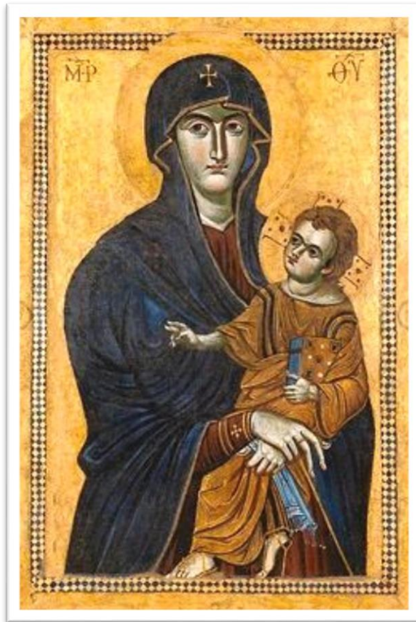
Ikona „Salus populi romani“

Pod obranu se tvoju utječemo (“Sub tuum praesidium”)