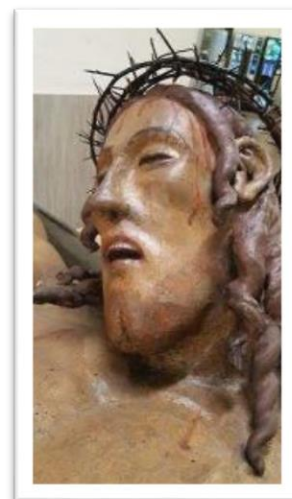
Molitva pred čudotvornim raspelom iz 15 st., iz crkve svetoga Marcela, pape i mučenika

Ant. Tvome križu klanjamo se, Gospodine, te hvalimo i slavimo sveto uskrsnuće tvoje, jer evo: drveta radi nastade radost u cijelome svijetu.